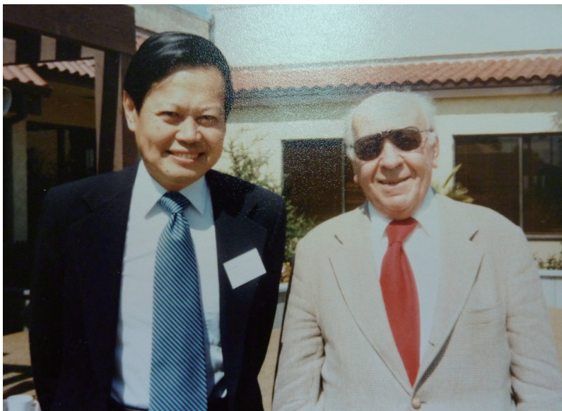
图3. 杨振宁与卡茨。卡茨以 Feynman-Kac 公式闻名，在 1940 年代与埃尔德什一起将概率方法引入数论

我大学尚未毕业，数学和物理的基础都不是很强，他兴致极高地跟我讲单位圆定理。虽然我完全不明白他说什么，可是他当时的极端兴奋，给我留下了不可磨灭的印象。他说他在这个问题上苦思良久没有结果，曾经去请教高等研究所著名数学家冯·诺依曼教授。冯·诺依曼亦不知如何措手。六个星期以后，他终于解决了困难，得到了全部证明。他当时还说，“这恐怕将是我一生中能证明的最美的定理。”多年以后，我提起他的这句话，他已经完全不记得了，可能是因为他做了更重要更美的的工作。